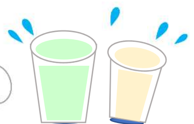
こまめな水分補給